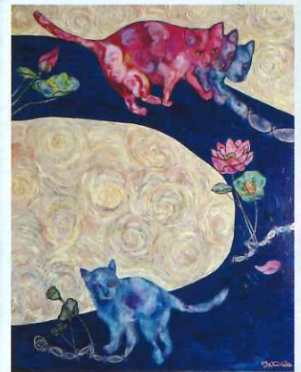
「蓮の旋律、猫の唄」キリオカマキ

固定観念にとらわれない自由でカラフルな色彩で見る人を魅了し、 “音楽が聴こえてくるような絵画”、“エネルギーで元気になる絵画”と好評を博している。