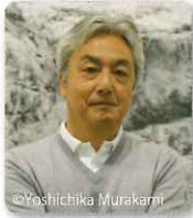
美術: 千住 博