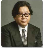
演出: 秋元 康